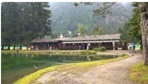
Ristorante Lago Gover