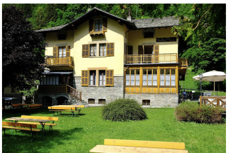
Hotel Villa Tedaldi