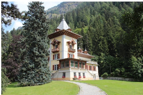
Villa Margherita – Municipio

Il patrimonio immobiliare è costituito dai seguenti principali edifici: