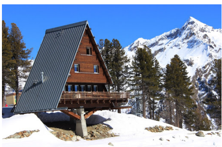
Casa Capriata – Rifugio Mollino