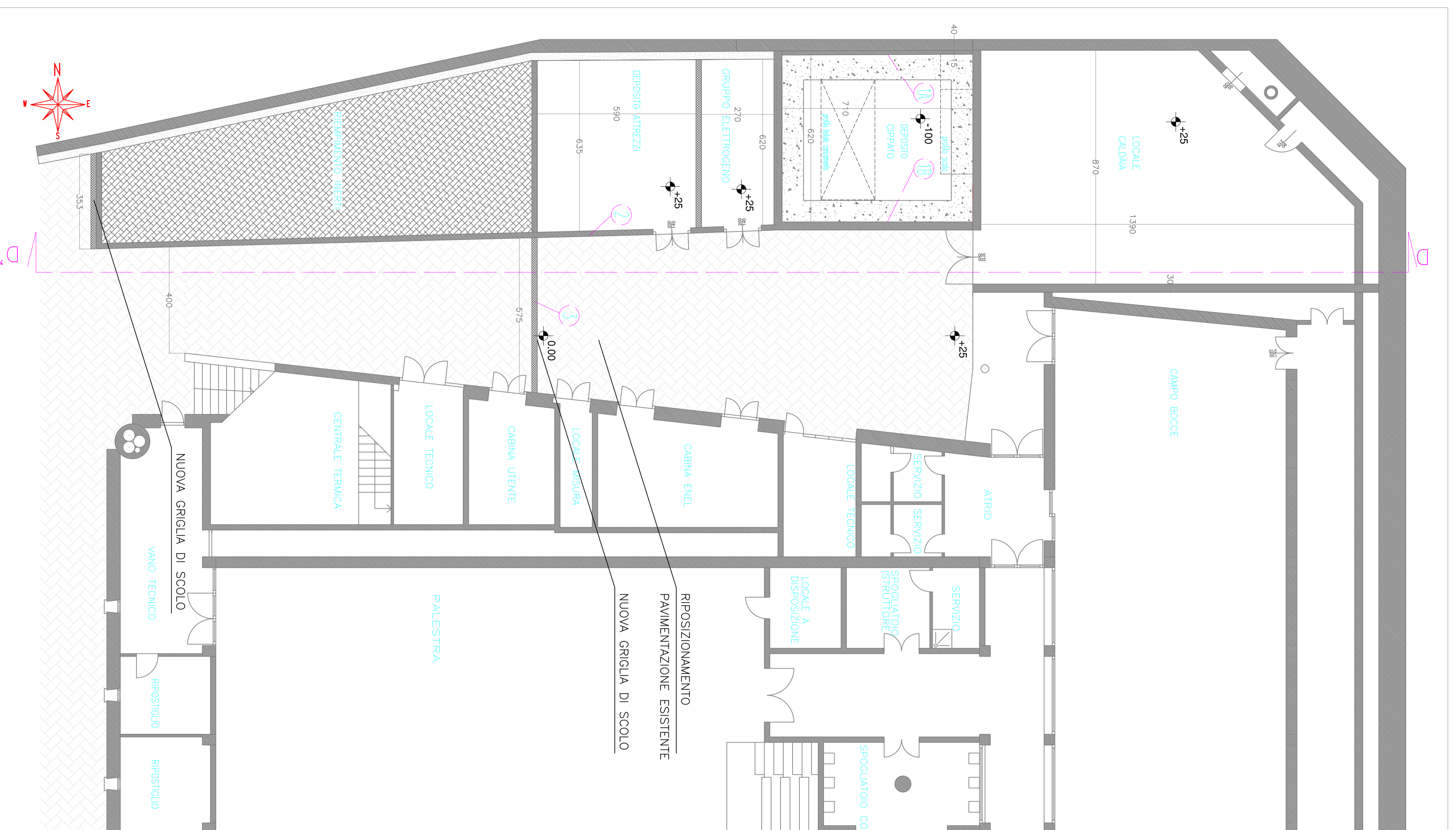
Stalio di planta scala 1:100